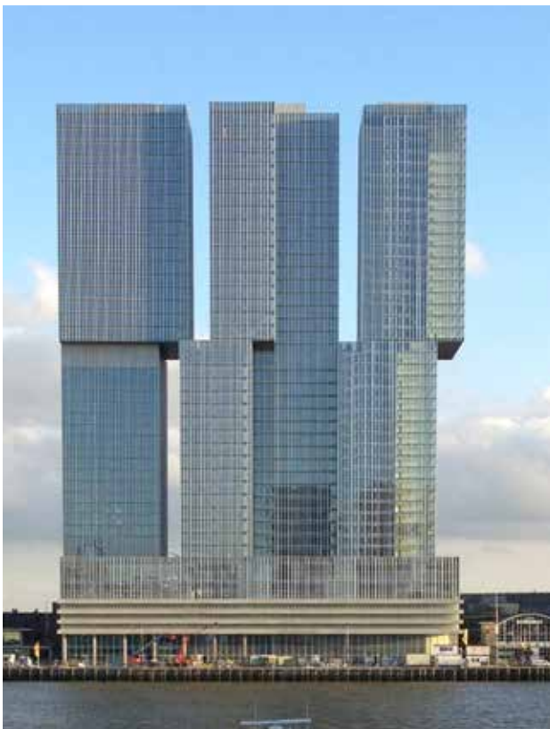
Office for Metropolitan Architecture OMA, De Rotterdam, Rotterdam, the Netherlands, 1997–2013.