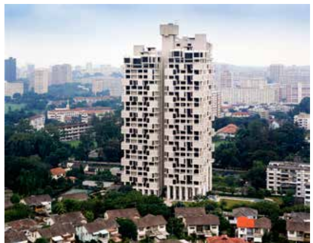
Paul Rudolph with Archiplan Team, Colonnade Condominium, Singapore, 1980–86.